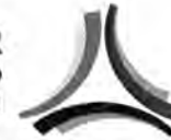
TABLA DE APLICABILIDAD DE LAS OBLIGACIONES DE TRANSPARENCIA COMUNES 2016 DE LA SECRETARÍA DE TURISMO

Artículo 70. En la Ley Federal y de las Entidades Federativas se contemplará que los sujetos obligados pongan a disposición del público y mantengan actualizada, en los respectivos medios electrónicos, de acuerdo con sus facultades, atribuciones, funciones u objeto social, según corresponda, la información, por lo menos, de los temas, documentos y políticas que a continuación se señalan: